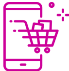
Aplicación Móvil para Compradores Personales (MPS)