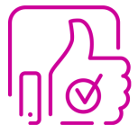
Experiencia Intuitiva de Usuarios