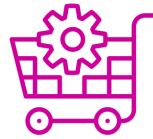
Optimización de Pedidos